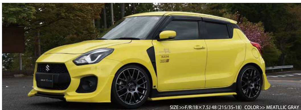
SIZE>>F/R:18×7.5J 48 (215/35-18) COLOR>> METALLIC GRAY