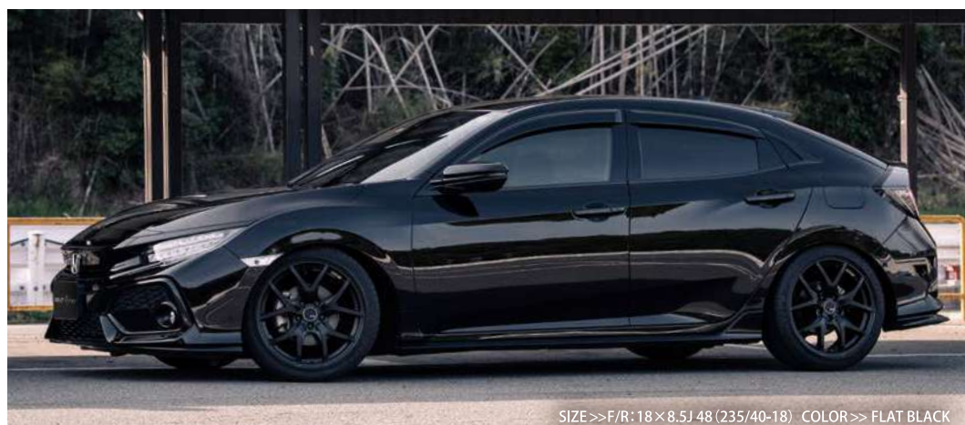
SIZE>>F/R: 18×8.5J 48 (235/40-18) COLOR>> FLAT BLACK