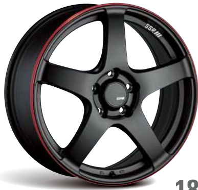
FLAT BLACK/RED LINE