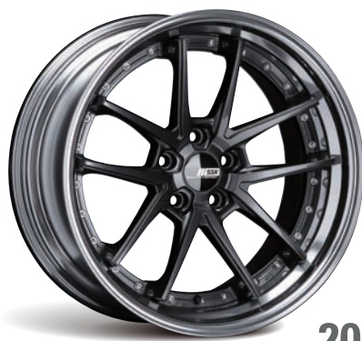
20" PRISM DARK GUNMETAL (スーパーコンケイブ) type10S