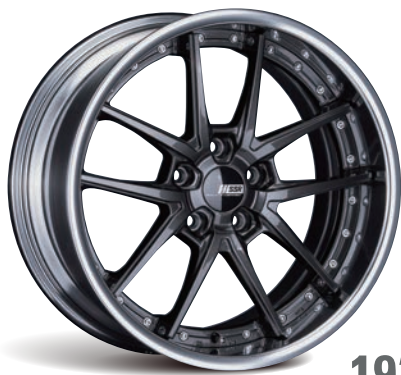
19" PRISM DARK GUNMETAL (スタンダードコンケイブ) type10R