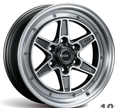
D.G.P. (DARK GUNMETAL POLISH)