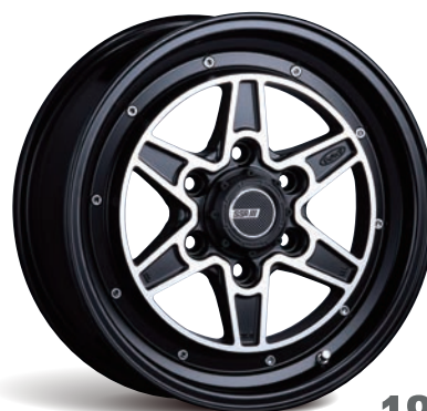
FLAT BLACK POLISH LIMITED EDITION