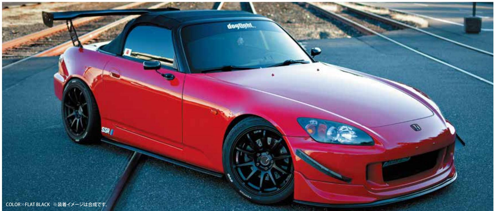
COLOR>>FLAT BLACK ※装着イメージは合成です。