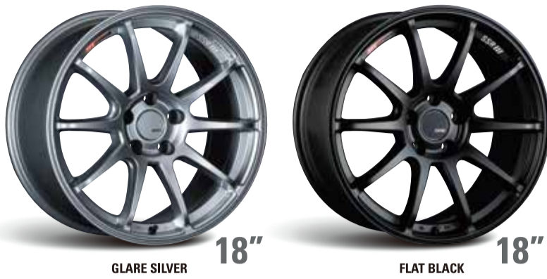
GLARE SILVER 18"