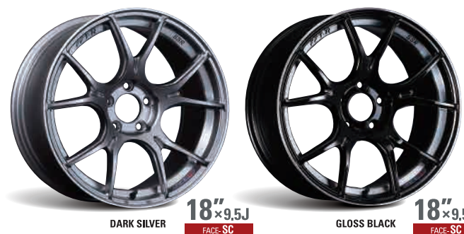
DARK SILVER 18"×9.5J FACE-SC