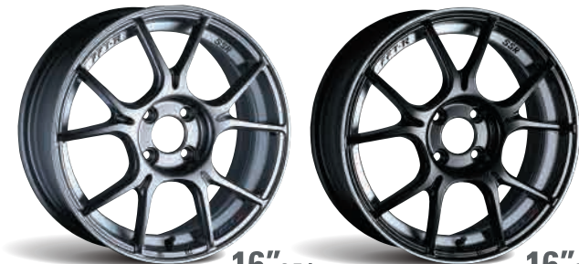
DARK SILVER 16"×6.5J FACE-STD