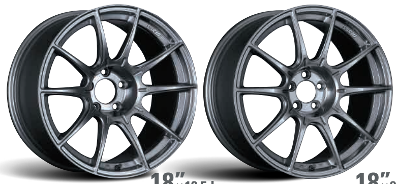
DARK SILVER 18"×10.5J FACE-SC