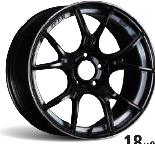
18×9.5J GLOSS BLACK FACE-B