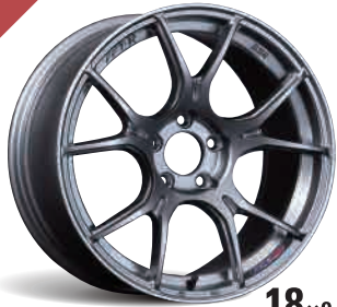
18×9.5J DARK SILVER FACE-B