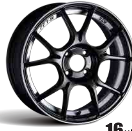
16×6.5J GLOSS BLACK FACE-B