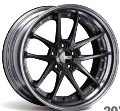
PRISM DARK GUNMETAL (スタンダードコンケイブ) type10R